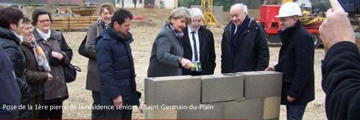
Pose de la 1ère pierre de la résidence séniors à Saint-Germain-du-Plain