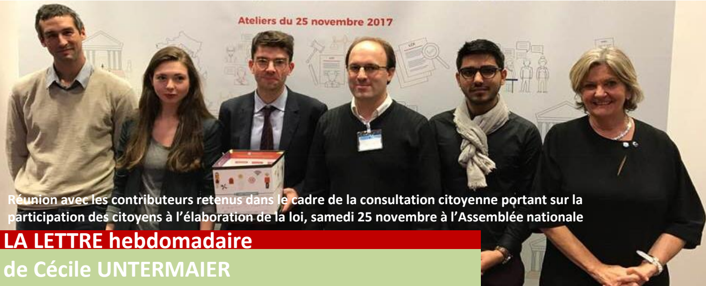
Réunion avec les contributeurs retenus dans le cadre de la consultation citoyenne portant sur la participation des citoyens à l'élaboration de la loi, samedi 25 novembre à l'Assemblée nationale