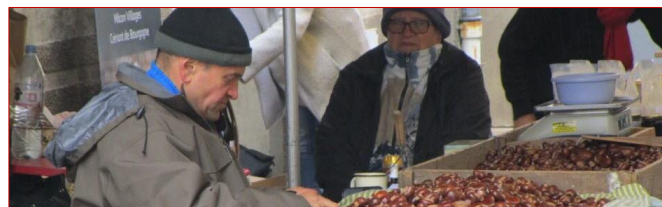
36 e foire de la Saint-Simon à Cuiseaux