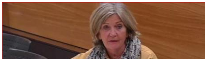
Crédits des missions « Sécurités » et « Immigration, asile et intégration »