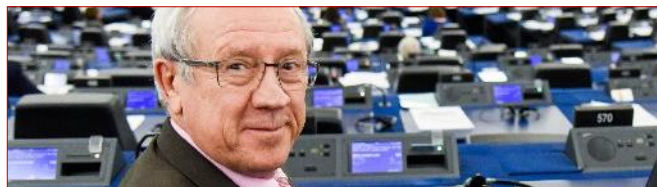
27 députés européens unissent leur voix pour le climat