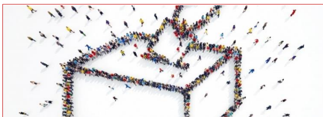
Clarification du droit électoral : mon intervention en discussion générale | #DirectAN