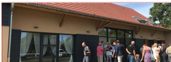
Inauguration du gîte communal de Torpes | #Tourisme