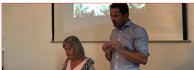
Retour sur l'Atelier Législatif Citoyen relatif au projet de loi "Engagement et Proximité" | #ALC4