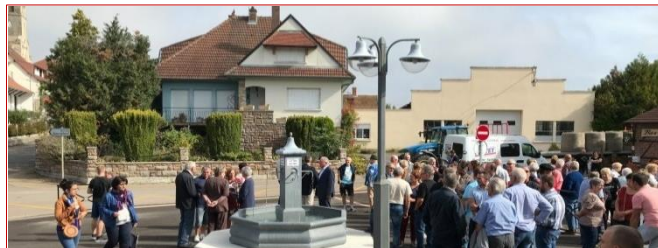
Le foyer rural de Saillenard entièrement rénové | #Territoire