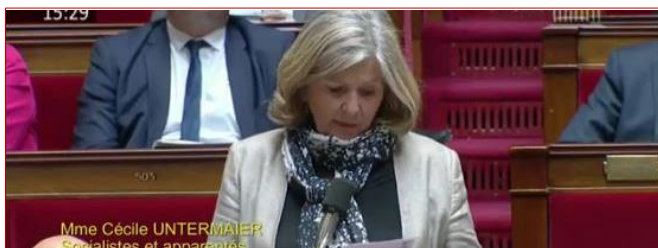
Pension alimentaire : ce qui va changer pour les pensions impayées | #ARIPA