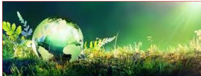
Création du groupe de travail "Pacte vert pour l'Europe" #APFA