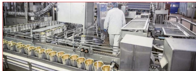
Mon courrier sur le projet de fermeture du bac pro bio industries de transformation à Louhans #Agro