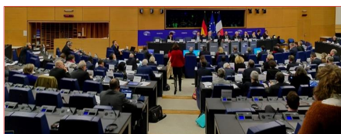
Réunion plénière de l'Assemblée parlementaire franco-allemande à Strasbourg #APFA