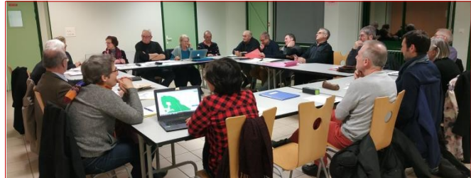
Réunion de l'association des amis du parc naturel régional de Bresse à Mervans #PNRBb