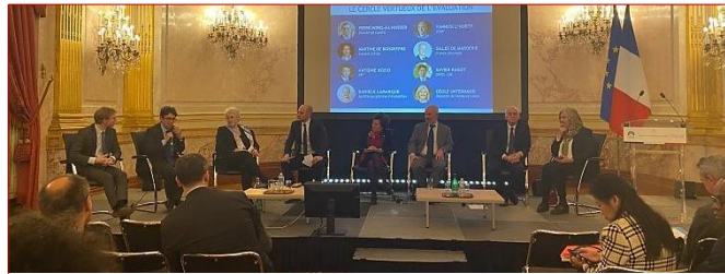
Les "rencontres de l'évaluation" à l'Assemblée nationale #Concrétisation En savoir plus