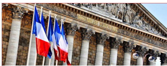
Mon interview pour Contexte journal politique de l'Assemblée #Parlementaire En savoir plus