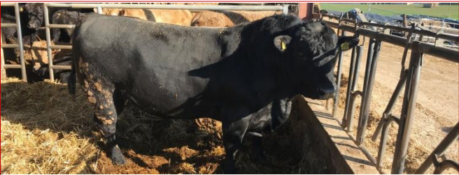
Visite de l'élevage "black angus" d'Alix Trossat à Beauvernois #Agriculture En savoir plus