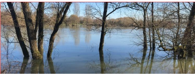
Visite de la commune de Fretterans #Territoires En savoir plus

Bresse Tournugeois Val-de-Saône Chalonnais