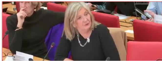
Examen du rapport d'information sur l'immunité parlementaire #ComLois En savoir plus