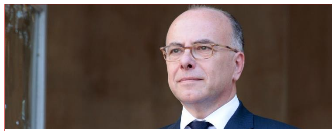
Bernard Cazeneuve à Frangy-en-Bresse le dimanche 20 septembre.