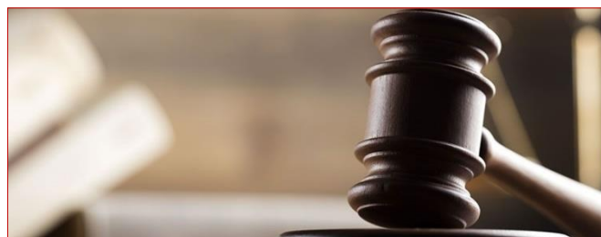
Examen du rapport de la Commission d'enquête sur l'indépendance de la justice