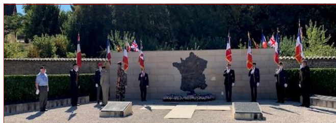
76 ème commémoration de la Libération de Sennecey-le-Grand