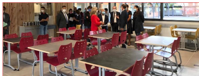
Rentrée scolaire au collège de Saint-Martin-en-Bresse

Le projet de loi organique relatif au Conseil économique, social et environnemental (CESE) sera examiné à l'Assemblée nationale dès le mardi 8 septembre avec l'audition du garde des Sceaux, ministre de la Justice, puis en Commission des lois. En tant que responsable de mon groupe, je participerai à ce travail et défendrai nos amendements. Lire la suite