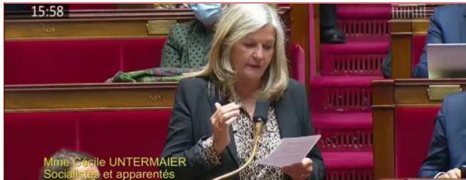
Ma question au garde des Sceaux sur la surpopulation carcérale #Dignité