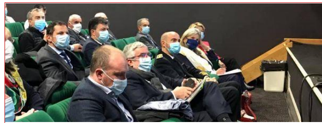
Assemblée générale des maires des communes rurales à Matour #Territoire