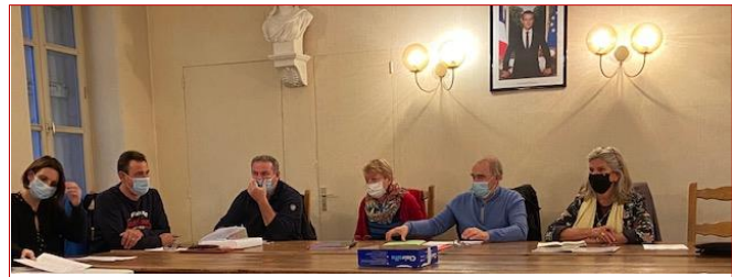
Rencontre avec les élus municipaux de Romanay #Communes