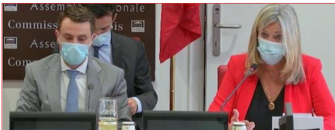
Présentation de notre communication sur les officiers publics et ministériels #Déontologie