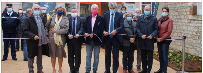
Ouverture d'une Maison de santé pluridisciplinaire à Fragnes-la-Loyère #Santé